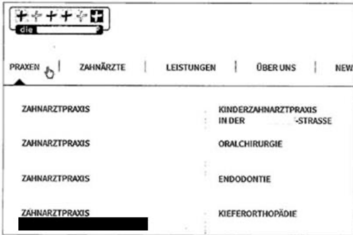
Anlage K 2