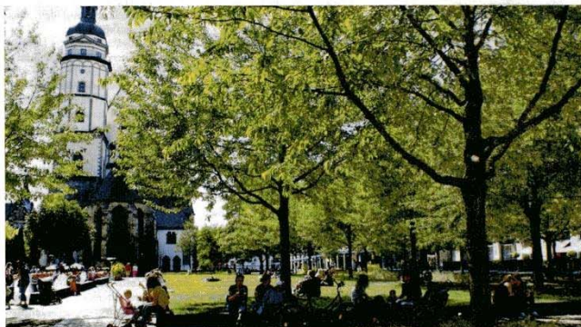
Blick in den Park vor der Thomaskirche, in der sich die Grabstätte Johann Sebastian Bachs befindet.